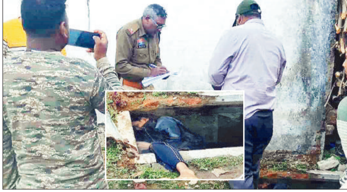
घटना स्थल पर जांच करती पुलिस, इनेसट में मृतक।