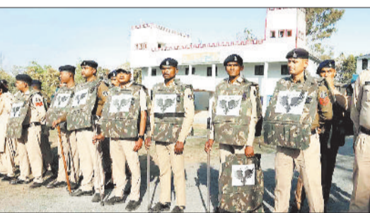
हरिभूमि न्यूज अंबिकापुर