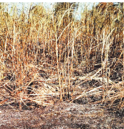
नुकसान हुआ है, घटना की सूचना मिलते ही आसपास के ग्रामीण मौके पर पहुंच गए। बालिटियों, मोटर पंप

एक ओर से धुआं उठता दिखाई दिया। देखते ही देखते आग ने विकराल रूप धारण कर लिया और तेज हवा के कारण लपटें पूरे खेत में फैल गईं। ग्रामीणों का कहना है कि गन्ने की सूखी पत्तियों ने आग को और भड़काया, जिससे आग बुझाना बेहद मुश्किल हो गया। कुछ ही समय में हर-भरे खेत की गन्ने राख का ढेर नजर आने लगा। बताया जा रहा है कि आग की चपेट में केवल फसल ही नहीं आई, बल्कि खेत में सिंचाई के लिए स्थापित ट्यूबवेल भी क्षतिग्रस्त हो गया। ट्यूबवेल में लगा स्टार्टर, विद्युत केबल, मोटर से जुड़ी तारें और खेत में बिछाई गई पाइप लाइन जलकर खाक हो गईं। प्रारंभिक अनुमान के अनुसार हजारों रुपए का